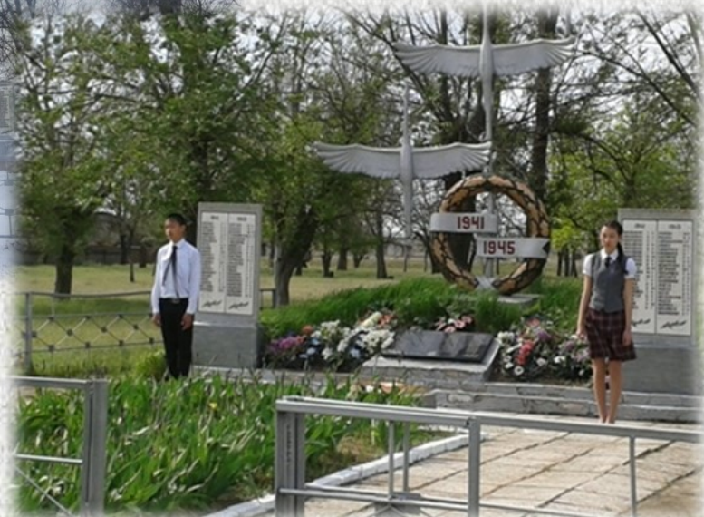
Мемориальный комплекс «Журавли, взметнувшиеся в небо». 1985 год