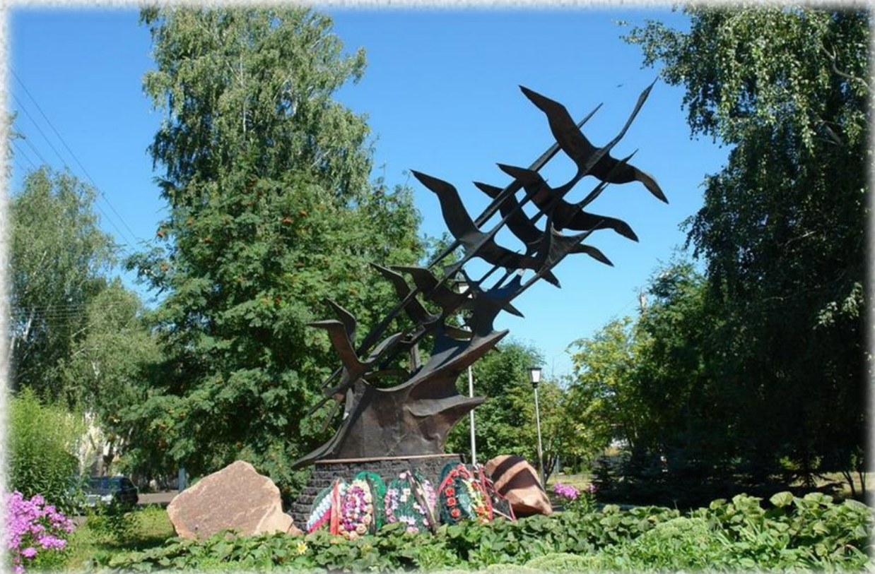
Памятник воинам-интернационалистам «Летят журавли».