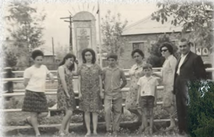
Первый памятник братьям Газдановым, надгробная плита с семью стрелами. 1963 год