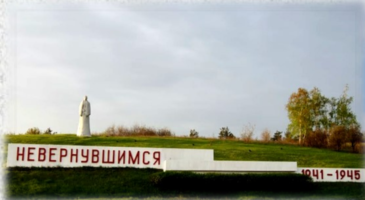
Мемориальный комплекс «Невернувшимся», (в народе «Журавли»). 1975 год