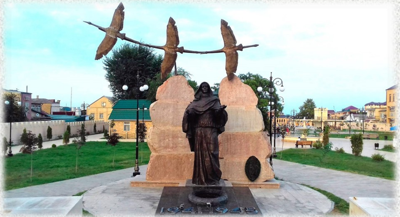
Мемориал «Скорбящая мать».