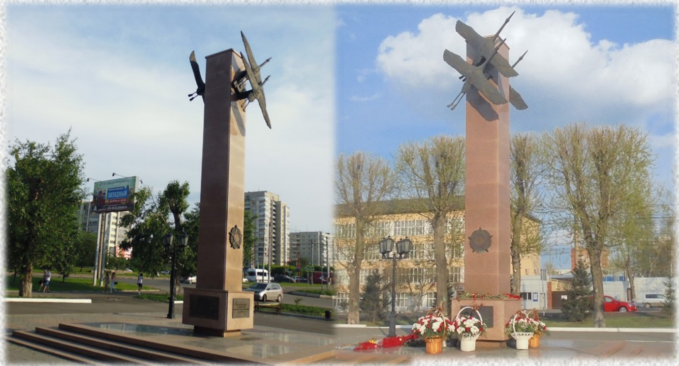
Скульптурная композиция «Журавли».