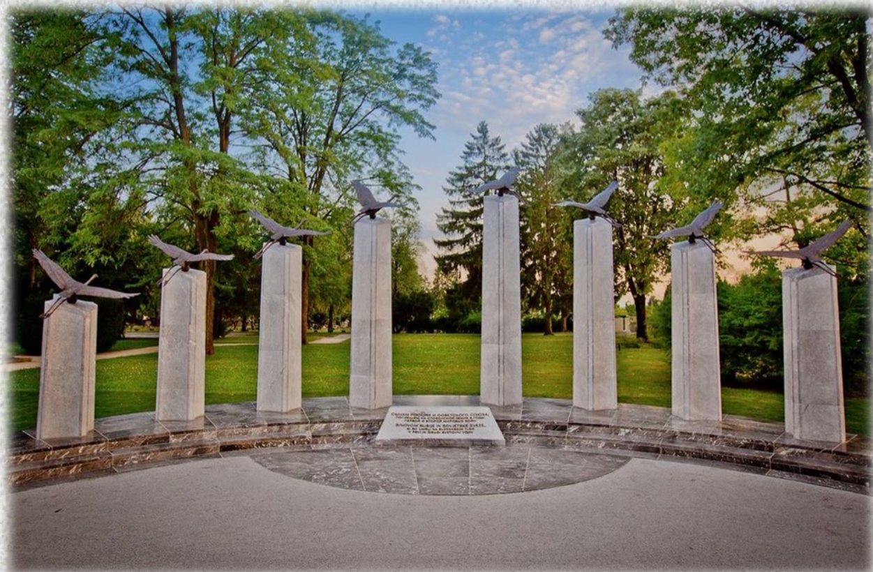
Мемориал «Сынам России и Советского Союза, погибшим на словенской земле в годы Первой и Второй мировых войн». 4 мая 2016 года