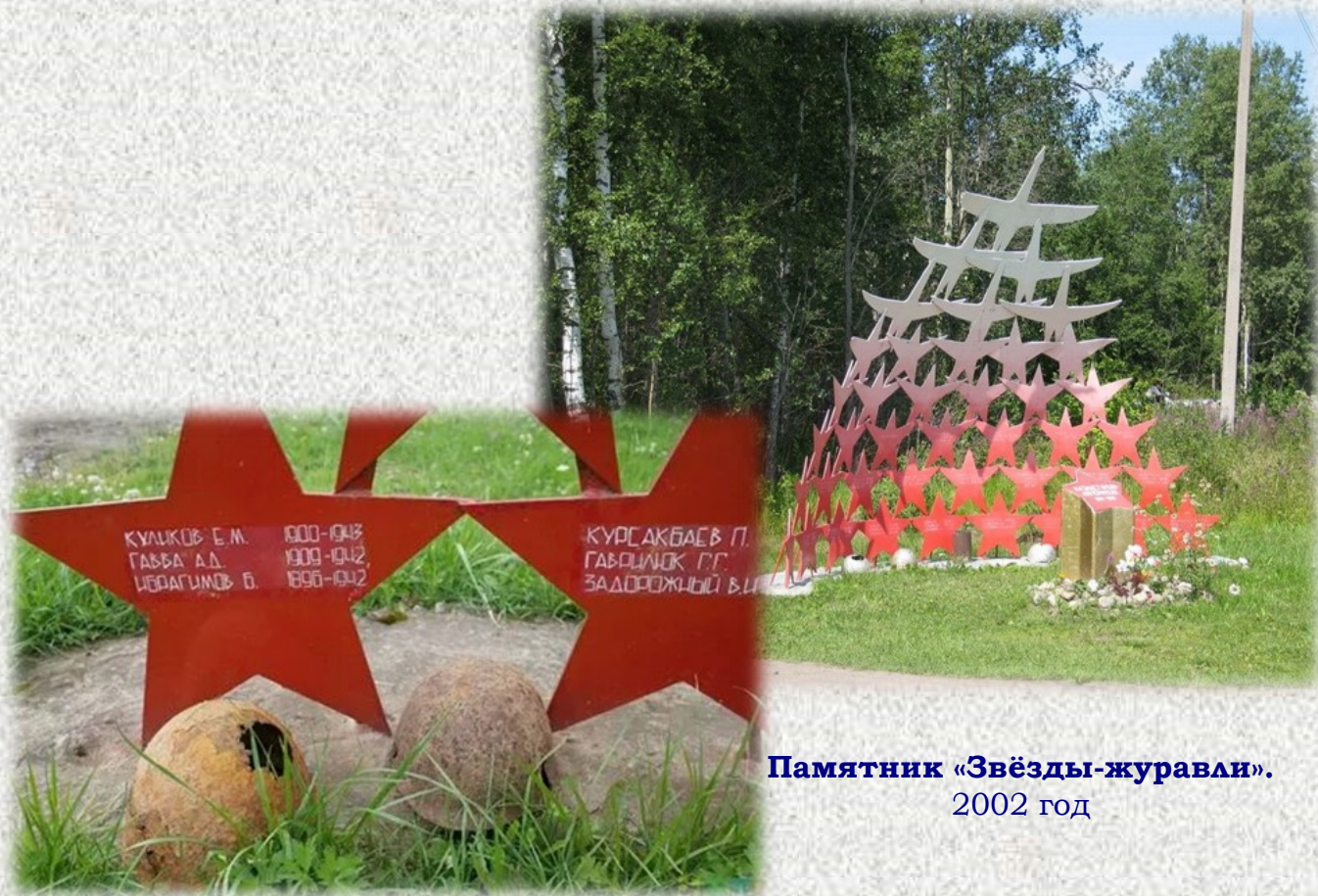
Памятник «Звёзды-журавли». 2002 год