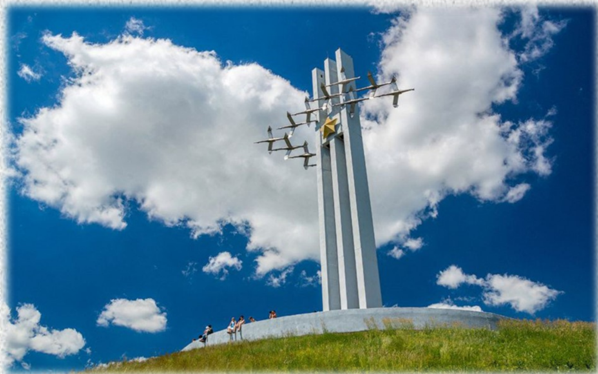
Мемориальный комплекс «Журавли». 1982 год