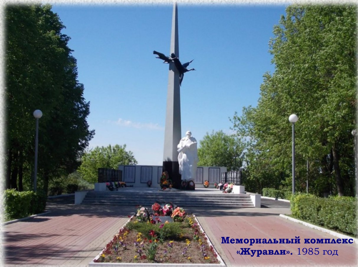
Мемориальный комплекс «Журавли». 1985 год