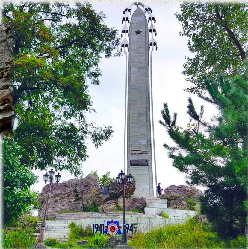
Мемориальный комплекс «Белые журавли». 1986 год