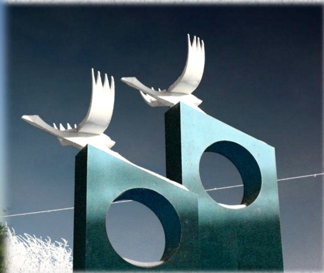
Памятник «Журавли». 1995 год