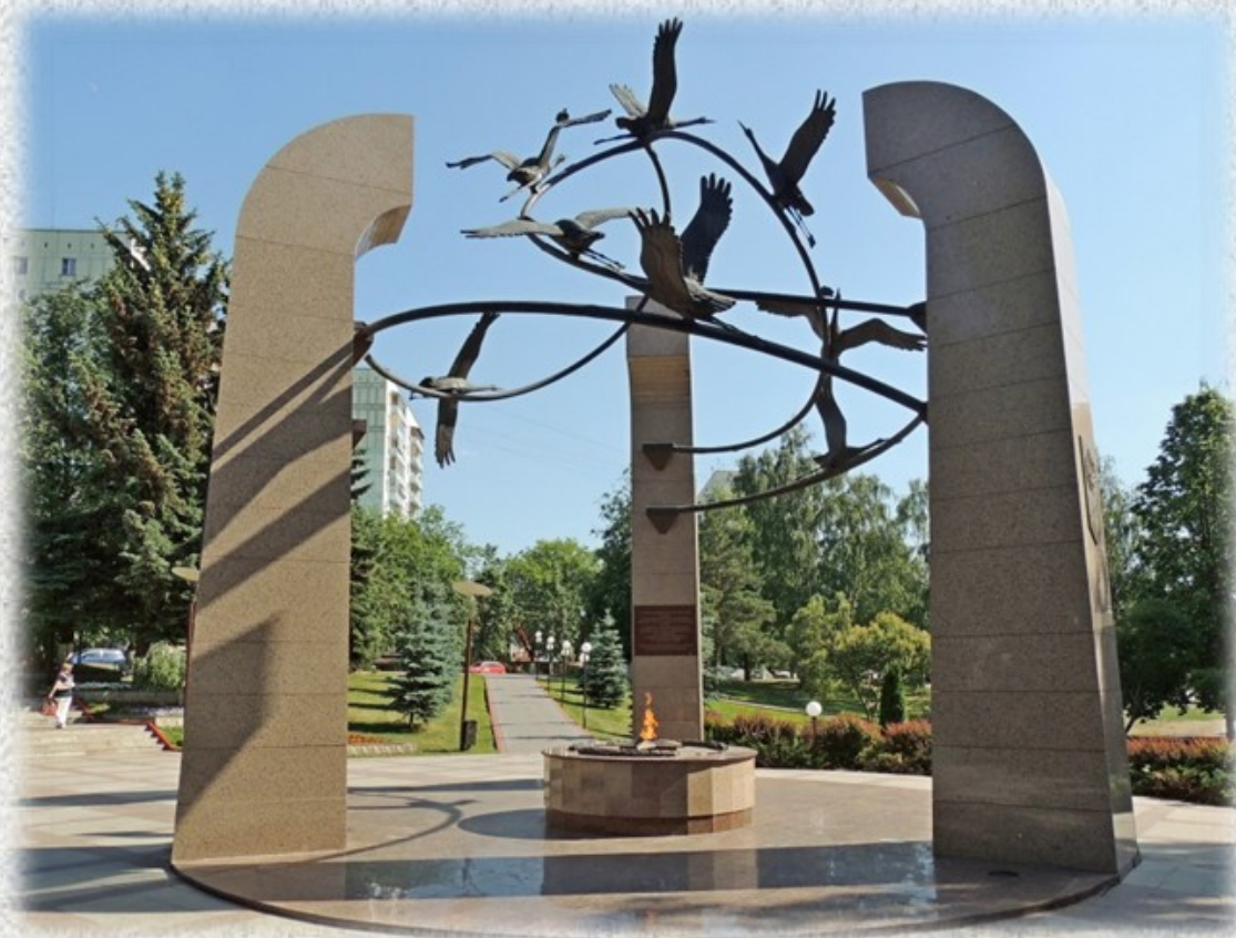
Скульптурная композиция «Журавли». Май 2005 года