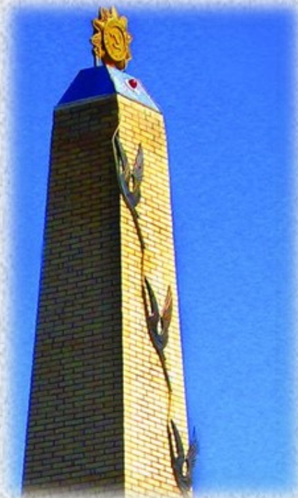
Памятник «Белые журавли». 9 мая 2005 года