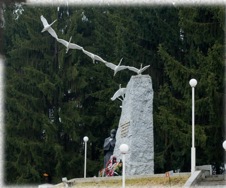
Памятник семи братьям Газдановым 8 мая 1975 года