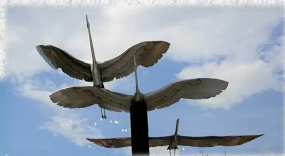
Скульптурная композиция «Журавли нашей памяти». 22 июня 2016 года