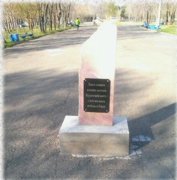
Камень, заложенный в 2013 году

Памятник «Журавли моей памяти». 1 марта 2018 года