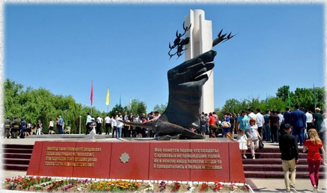
Памятник «Журавли». 8 мая 1972 года