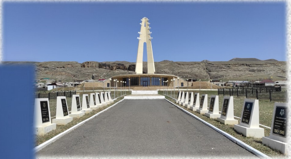
Мемориальный комплекс «Белые журавли». 2013 год