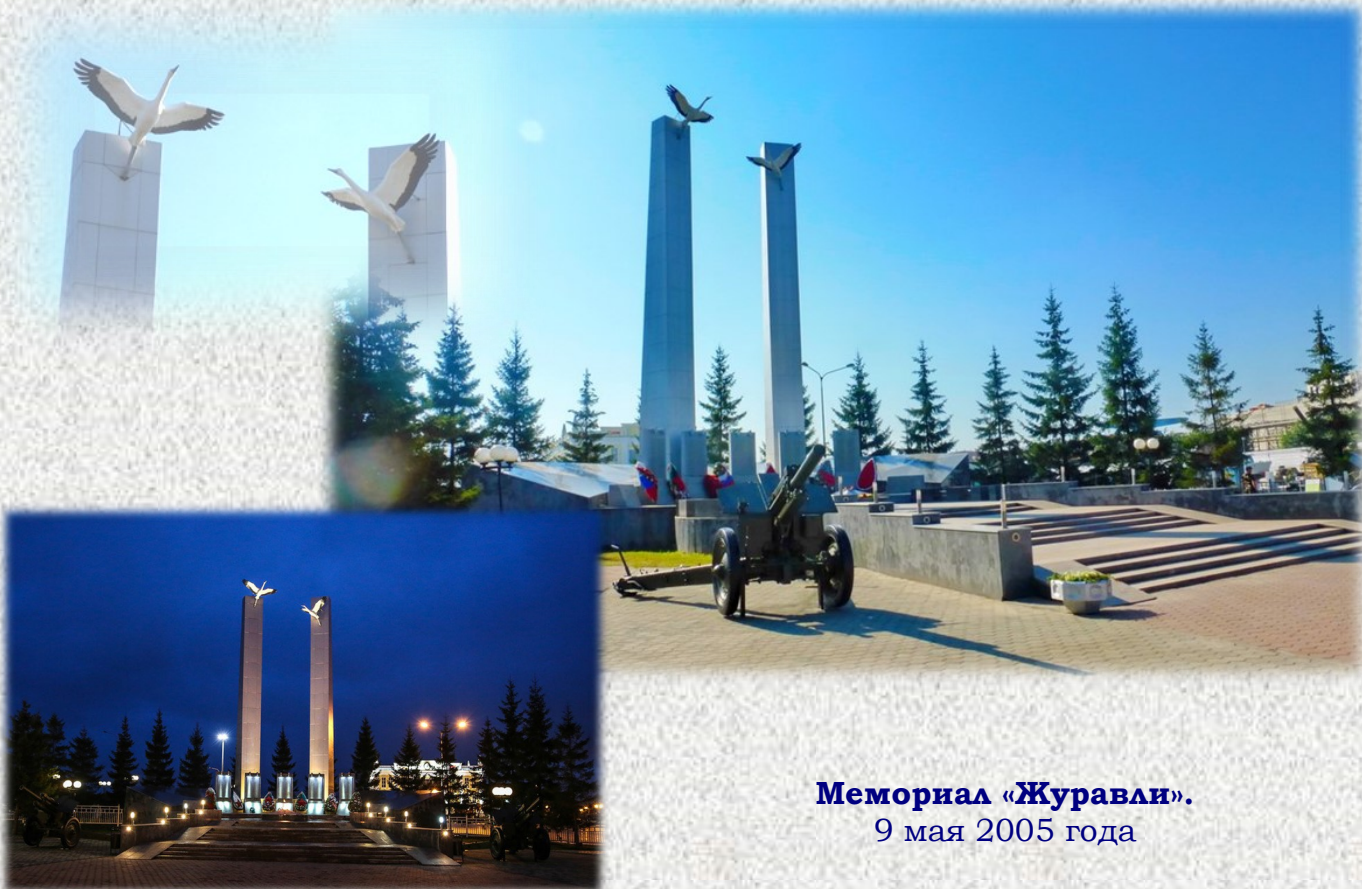
Мемориал «Журавли». 9 мая 2005 года