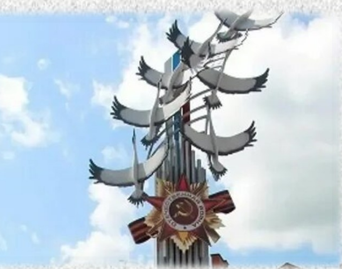
Памятник «Ушедшие в бессмертие». 2013 год