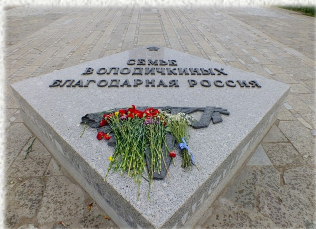
Памятник семье Володичкиных. 8 мая 1995 года