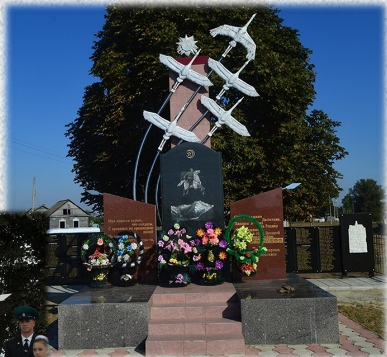
Памятник «Журавли». 27 августа 2012 года