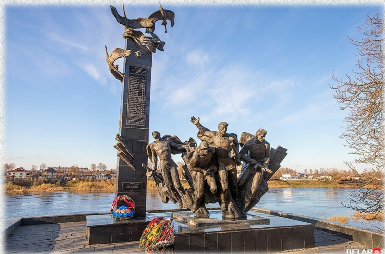
Памятник «23 советским солдатам под командованием лейтенанта А.М. Григорьева». 1989 год