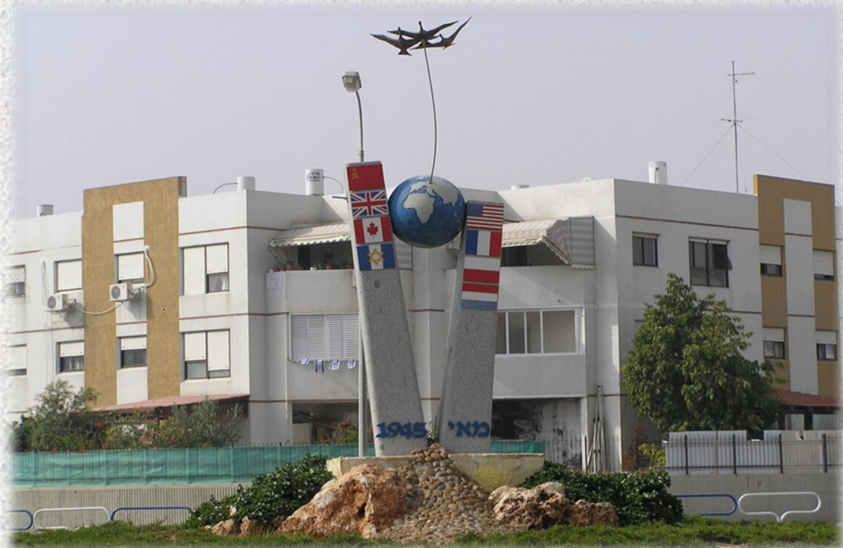
Памятник Победы. Дата установки неизвестна