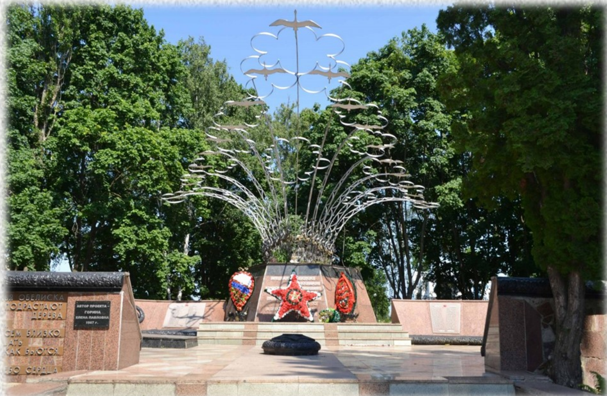
Мемориал Славы «Журавли» братская могила советских воинов.