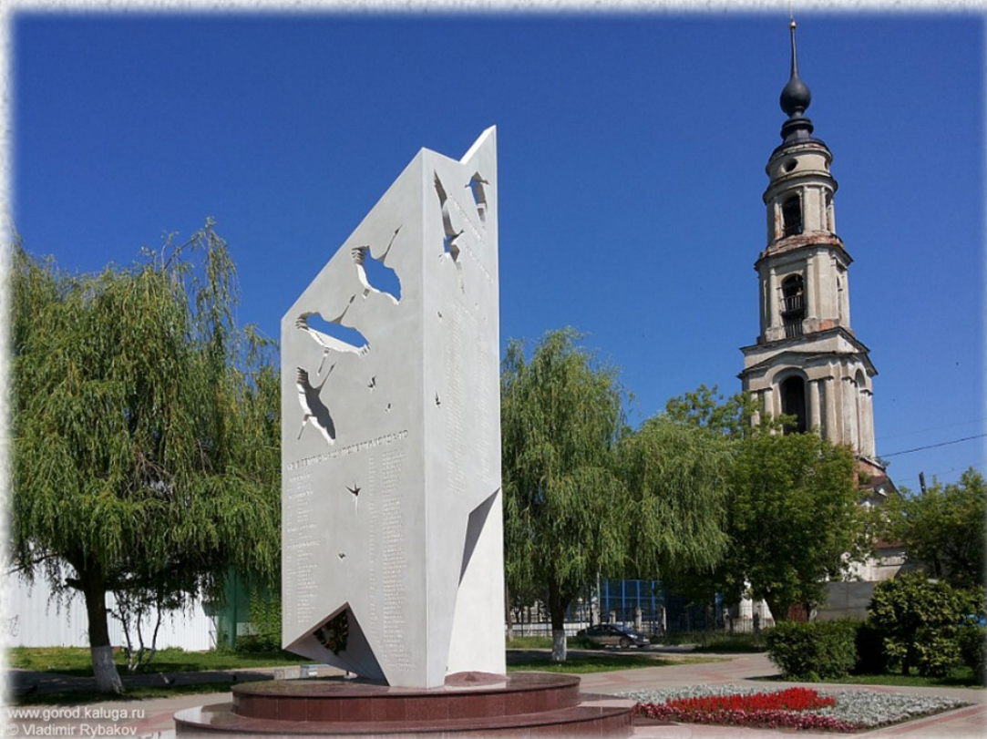
Памятник «Журавли». 15 мая 2013 года