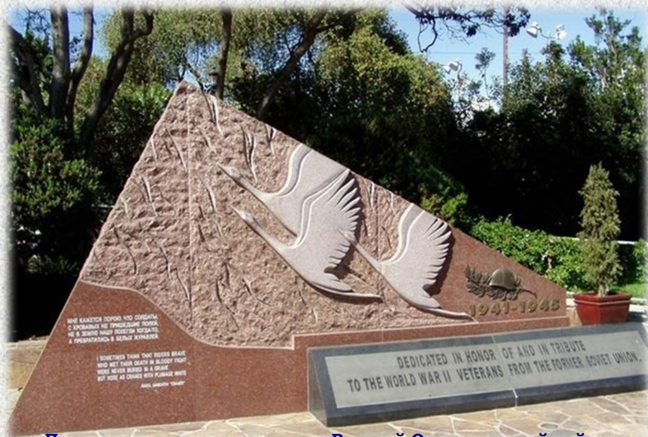
Памятник советским солдатам Великой Отечественной войны.