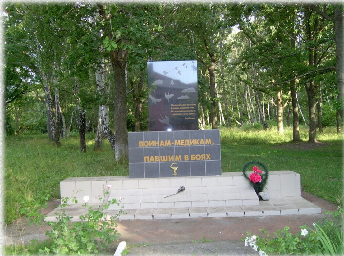
Памятник медикам Балтики.