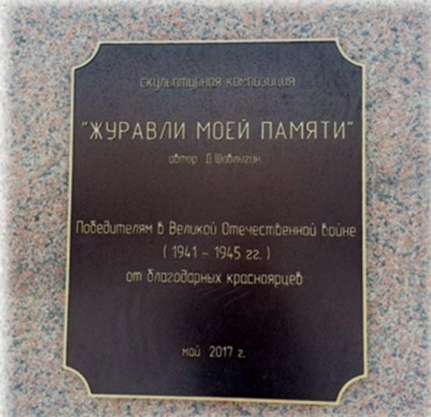
Скульптурная композиция «Журавли моей памяти». 4 мая 2017 года