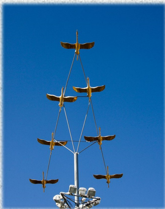
Памятник «Звёзды-журавли». Май 2005 года