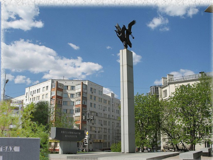
Мемориал «В память о жертвах терроризма». 23 октября 2003 года