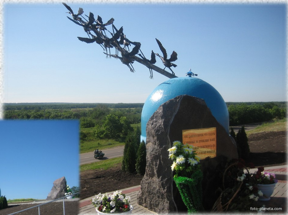
Мемориальный комплекс «Журавли». 2011 год