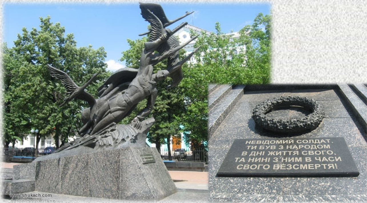
Пам'ятник Неизвестному солдату «Журавли». 2000 год