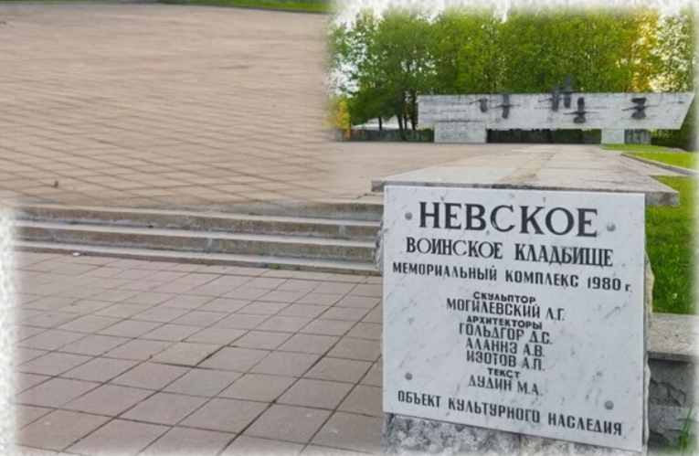
Мемориал «Журавли» на Невском воинском кладбище. 1980 год

Застывшая в поклоне фигура бронзовой девушки – символ вечной скорби по жертвам фашизма, мирным жителям- блокадникам и погибшим от ранений воинам Красной Армии.