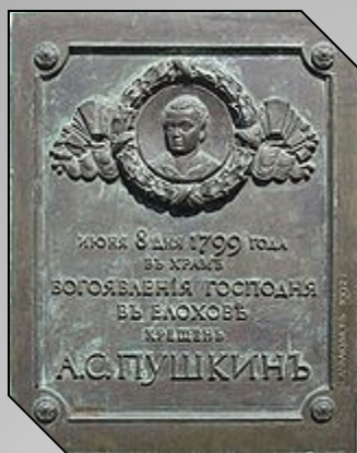
Мемориальная доска, посвящённая крещению А. С. Пушкина (скульптор - Н. М. Аввакумов)

Пушкин родился 26 мая (6 июня) 1799 г. в Москве.