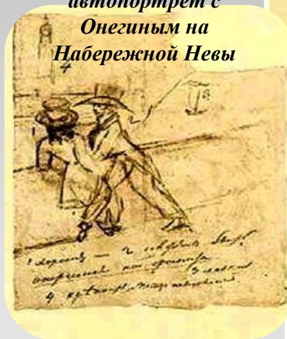
Автограф Пушкина – автопортрет с Онегиным на Набережной Невы