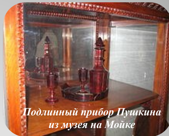
Подлинный прибор Пушкина из музея на Мойке

Широкой публике, сокрушающейся о падении пушкинского таланта, было неведомо, что лучшие его произведения не были пропущены в печать, что в те годы шёл постоянный, напряжённый труд над обширными замыслами: «Историей Петра», романом о пугачёвщине. В творчестве поэта назрели коренные изменения. Пушкин-лирик в эти годы становится преимущественно «поэтом для себя». Он настойчиво экспериментирует теперь с прозаическими жанрами, которые не удовлетворяют его вполне, остаются в замыслах, набросках, черновиках, ищет новые формы литературы.