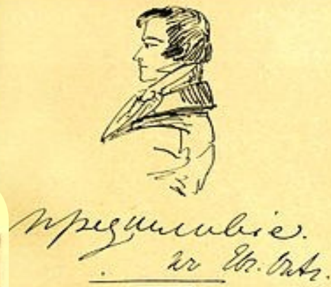
Авторский портрет Евгения Онегина, 1830 г. Подпись: Предисловіе к Евг. Онг