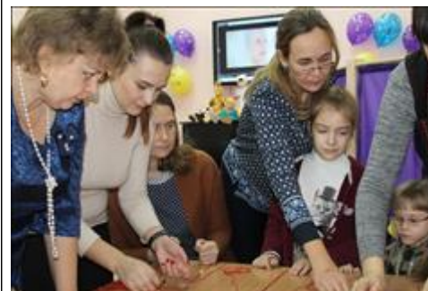
"Пусть всегда будет мама!" мастер - класс