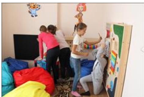
комната психологической разгрузки идет занятие