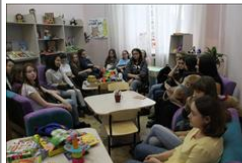
Уроки для волонтеров Идет обучающее занятие.