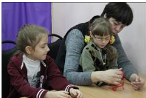
"Пусть всегда будет мама!" совместное творчество сближает