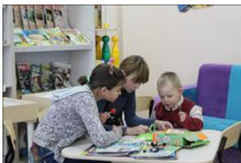
занятия в игровой дети в свободное от учебы время