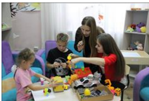
Уроки для волонтеров Идет занятие