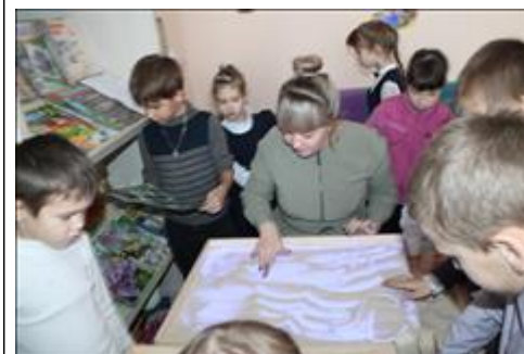
мастер - класс рисование песком