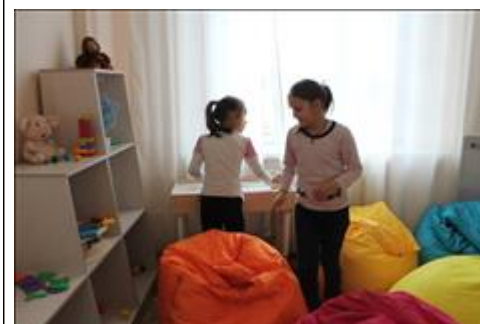
комната психологической разгрузки идет занятие