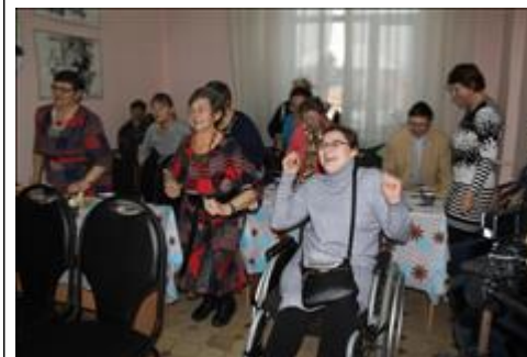
Праздник "Новый год у ворот" Игровая программа.

Мероприятие: Форум НКО и гражданских инициатив - 2019 «Современные форматы интеграции власти, бизнеса и общества»