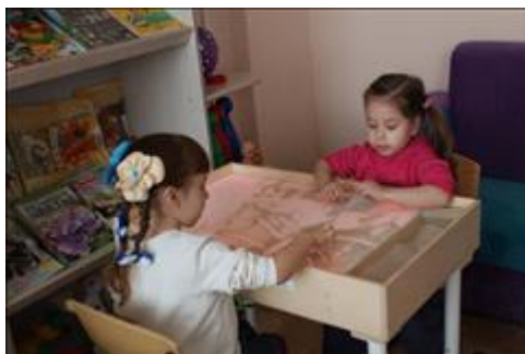
комната психологической разгрузки идет занятие