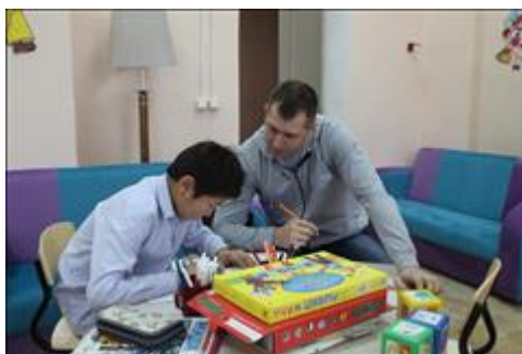
мастер - класс идет занятие