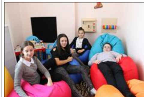
комната психологической разгрузки дети на занятиях