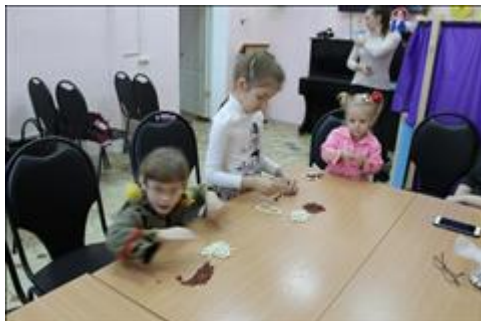
"Пусть всегда будет мама!" игровое занятие для детей