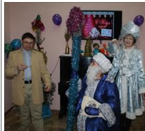
Праздник "Новый Год у ворот" праздничное представление в компании деда Мороза и Снегурочки.