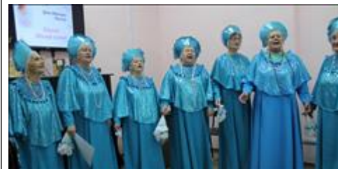
Праздничная программа "Мама, милая мама!" Праздничное поздравление ансамбля "Сударушки".