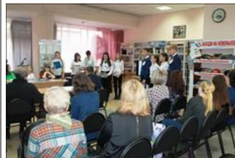
Форум Идет пленарная часть мероприятия.