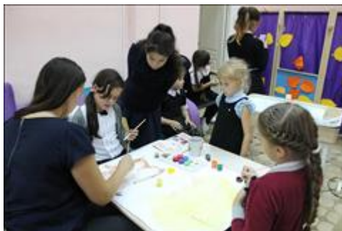
мастер - класс идет занятие