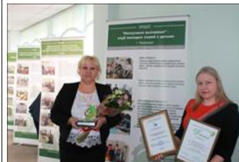
Форум НКО и гражданских инициатив - 2019 Специалисты НКО презентуют проект "Нескучные выходные".