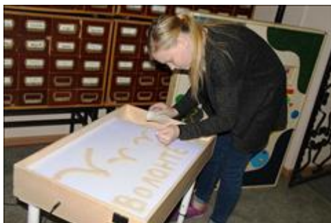
Форум Волонтер презентует новое оборудование: сенсорный столик для рисования песочком.