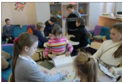
игровая дети играют