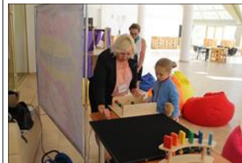
игры развивающие Данное оборудование презентовалось на Республиканском форуме инвалидов "Равные права - равные возможности" в Музейно - культурном центре Республики Хакасия