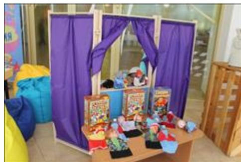
кукольный театр Данное оборудование презентовалось на Республиканском форуме инвалидов "Равные права - равные возможности" в Музейно - культурном центре Республики Хакасия

Информация, указанная Вами в данном поле отчета, будет доступна для посетителей сайта Фонда президентских грантов (в том числе представителей СМИ)