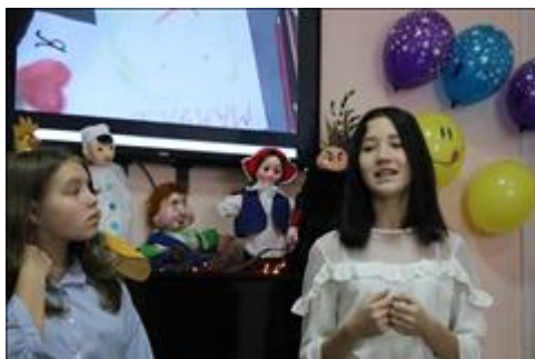
"Пусть всегда будет мама!" дети читают стихи о маме