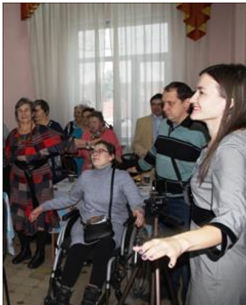
праздник "Новый Год у ворот" Семьи с детьми, опекуны, молодые инвалиды участвовали в игровой программе. Представители Правительства Республики Хакасия тоже не остались в стороне!