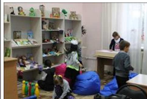
игровая свободное время в игровой с друзьями

Мероприятие: Новогодний праздник "Новый Год у ворот"