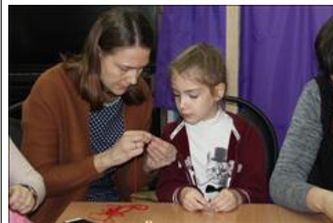
"Пусть всегда будет мама!" идет занятие