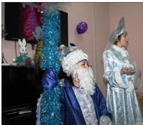
Праздник "Новый Год у ворот" Снегурочка читает предсказание на 2019 год. Всем весело!