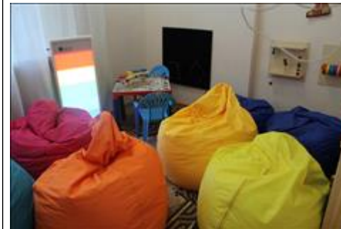
комната психологической разгрузки комната оборудована в Центре чтения и досуга на безвозмездной основе