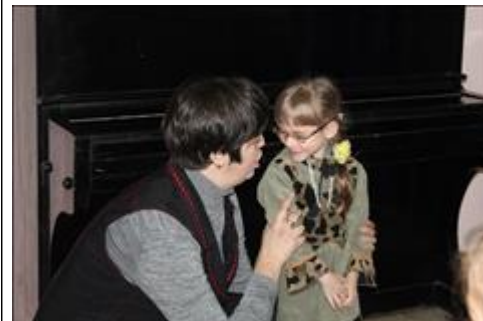
"Пусть всегда будет мама!" дети читают стихи о маме