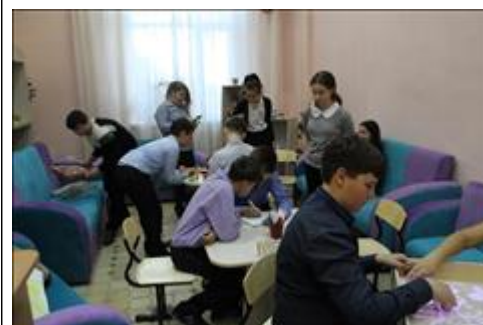
занятие в игровой в свободное от учебы время