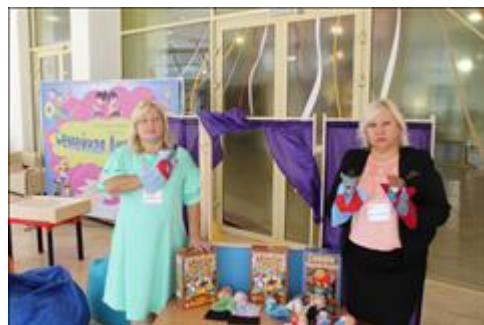
оборудование Данное оборудование презентовалось на Республиканском форуме инвалидов "Равные права - равные возможности" в Музейно - культурном центре Республики Хакасия