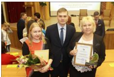
Форум НКО и гражданских инициатив - 2019 Специалисты НКО и Губернатор Республики Хакасия Коновалов Валентин Олегович.