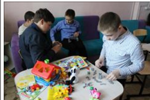
занятия в игровой воспитанники коррекционной школы - интернат