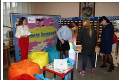
форум Презентуем оборудование, приобретенное в рамках проекта "Нескучные выходные"