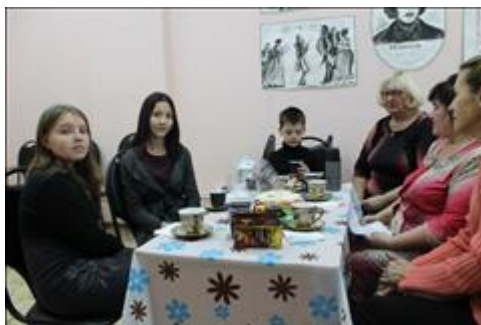
Праздничная программа "Мама, милая мама!" Совместное общение поколений за чашкой чая.