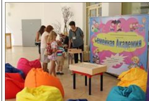
оборудование, приобретенное в рамках проекта Данное оборудование презентовалось на Республиканском форуме инвалидов "Равные права - равные возможности" в Музейно - культурном центре Республики Хакасия