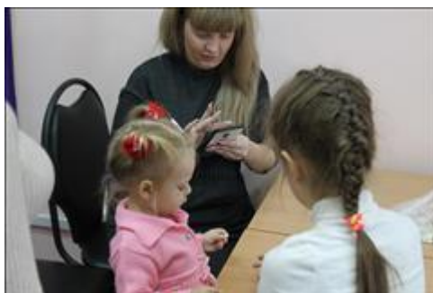
"Пусть всегда будет мама!" совместное творческое занятие