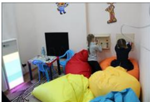
комната психологической разгрузки комната работает ежедневно с 9:00 - 18:00