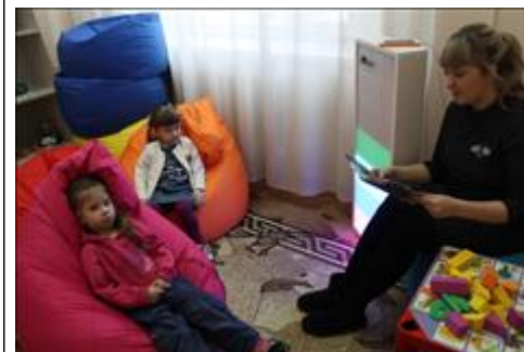
комната психологической разгрузки идет занятие