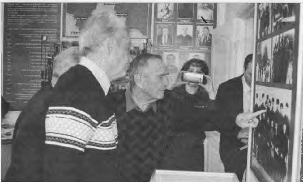
Ветераны службы узнавали себя на архивных фотографиях