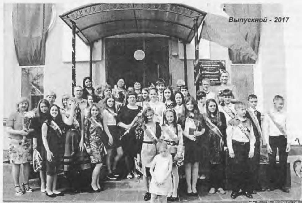
Выпускной - 2017

и о том, почему не стоит подгонять время