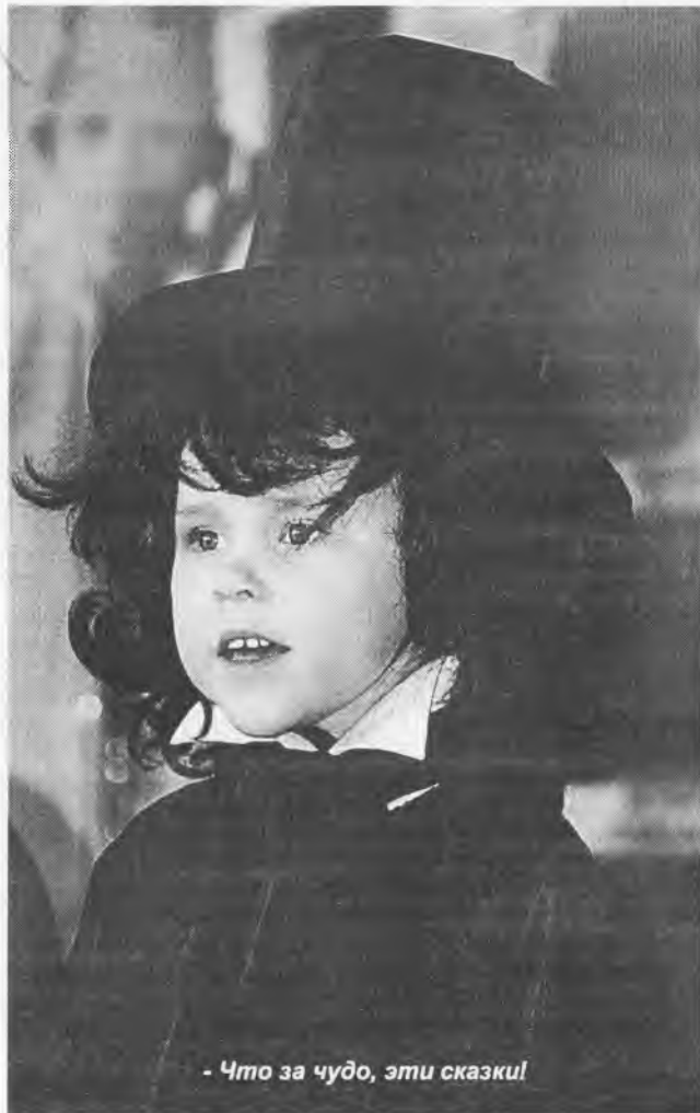
- Что за чудо, эти сказки!

Различных мероприятий «Почитателей Пушкина» было столько, что и рассказать обо всех невозможно. Но среди наиболее запомнившихся назову следующие.