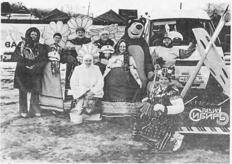
Коллектив школы и работает, и отдыхает вместе: "Сани-ФЭСТ" в Абакане

Наталья МЕРКУРЬЕВА