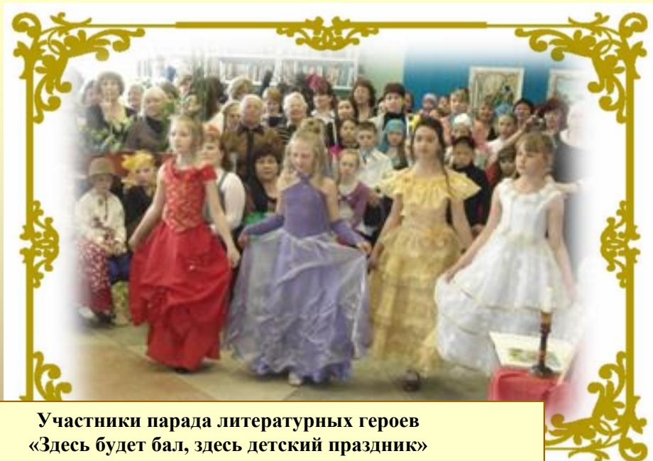
Участники парада литературных героев «Здесь будет бал, здесь детский праздник»