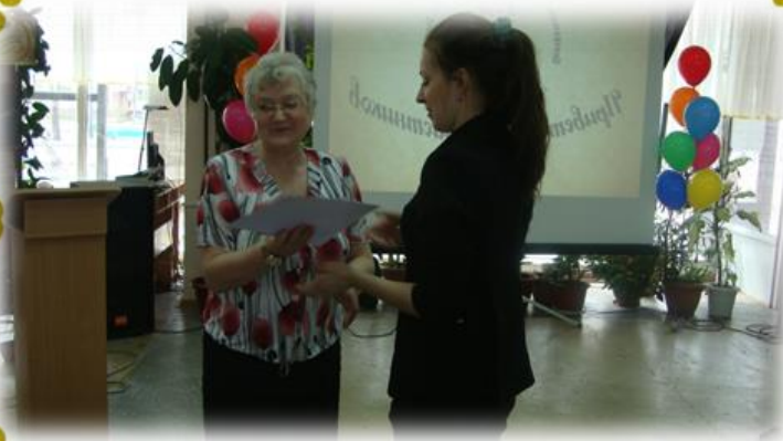
Вручение благодарностей за участие в VI Пушкинских чтениях