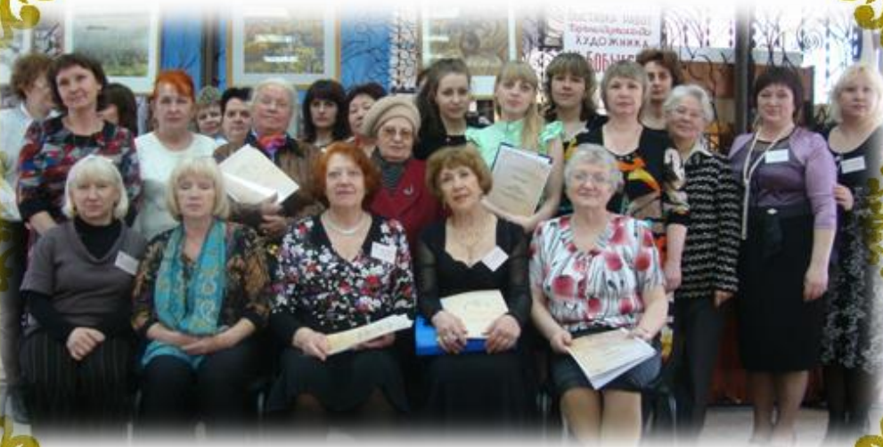
Участники VI Пушкинских чтений «Пушкин в движении эпох»